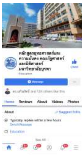
ภาพที่ ๑ Facebook ของหลักสูตรยุทธศาสตร์และความมั่นคง

หลักสูตรได้ประชาสัมพันธ์หลักสูตรผ่านทางเว็บไซต์ของคณะรัฐศาสตร์และนิติศาสตร์ และ Facebook ของงานบัณฑิตศึกษาและหลักสูตรยุทธศาสตร์และความมั่นคง ตลอดจน Social Network ต่างๆ ทั้งของส่วนกลางคณะและของคณาจารย์ในหลักสูตร นอกจากนี้อาจารย์ประจำหลักสูตรทุกคนได้ประชาสัมพันธ์หลักสูตรด้วยตนเองในโอกาสต่างๆ ดังนั้น ผู้มีส่วนได้ส่วนเสียสามารถเข้าถึงข้อมูลเกี่ยวกับหลักสูตรได้ตลอดเวลา