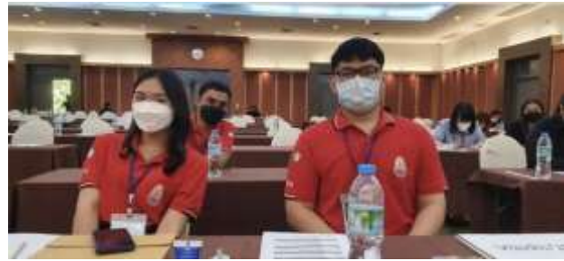
ภาพที่ 17 กิจกรรมเสริมหลักสูตร: นิสิตหลักสูตร รม. (ยุทธศาสตร์และความมั่นคง) ฝึกประสบการณ์เป็นผู้ช่วยจัดสัมมนาวิชาการระดับชาติ PSPARN 2022 ณ โรงแรมเทา-ทอง มหาวิทยาลัยบูรพา ระหว่างวันที่ 22-24 เมษายน 2565