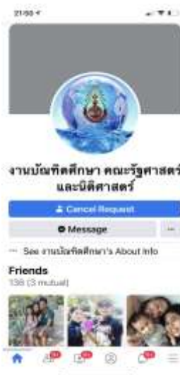
ภาพที่ ๒ Facebook ของงานบัณฑิตศึกษา คณะรัฐศาสตร์และนิติศาสตร์