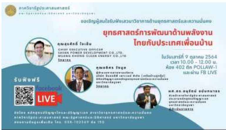
ภาพที่ ๑๘ กิจกรรมเสริมหลักสูตร: เสวนาวิชาการด้านยุทธศาสตร์และความมั่นคงในหัวข้อ “ยุทธศาสตร์การพัฒนาพลังงานไทยกับประเทศเพื่อนบ้าน” ในวันที่ ๙ ตุลาคม ๒๕๖๔

๒.๖.๕. The competences of the support staff rendering student services are shown to be identified for recruitment and deployment. These competences are shown to be evaluated to ensure their continued relevance to stakeholders needs. Roles and relationships are shown to be well-defined to ensure smooth delivery of the services.