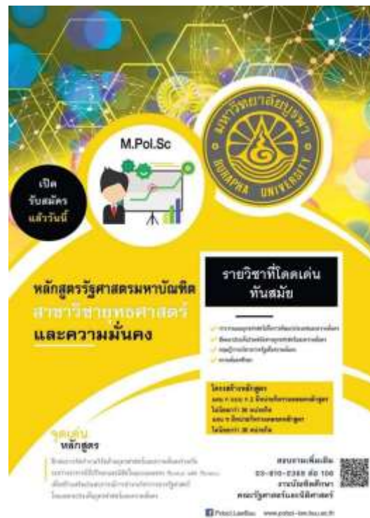
ภาพที่ ๙ แผ่นพับ โปสเตอร์ ประชาสัมพันธ์หลักสูตร ที่เผยแพร่ในเว็บไซต์ Facebook Line