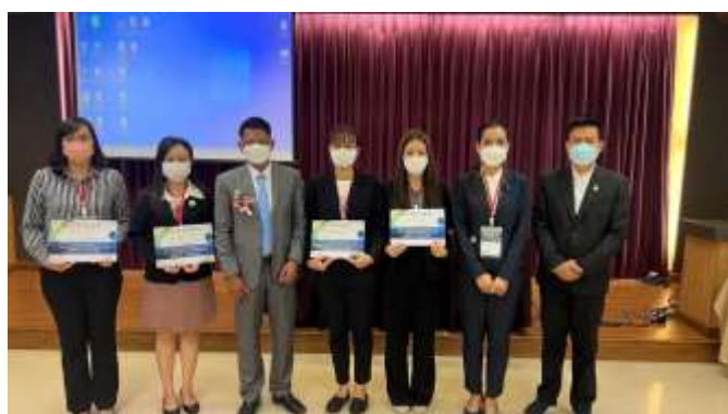
ภาพที่ ๖ นิสิตหลักสูตร ร.ม. (ยุทธศาสตร์และความมั่นคง) ได้รับประกาศนียบัตรในการนำเสนอบทความในการประชุมวิชาการระดับชาติ เครื่องานความร่วมมือทางวิชาการ วิทยาศาสตร์และรัฐประศาสนศาสตร์ ครั้งที่ ๖