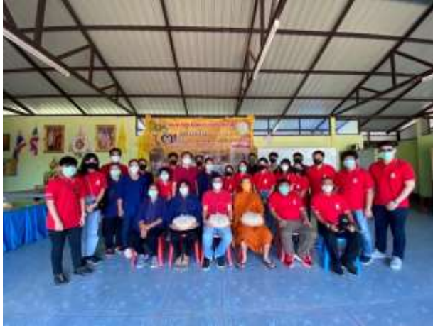
ภาพที่ ๘ กิจกรรมฝึกประสบการณ์การทำวิจัยในพื้นที่จังหวัดสระแก้ว นิสิตหลักสูตรรบ. (ยุทธศาสตร์และความมั่นคง) ได้ศึกษาเก็บข้อมูล เกี่ยวกับการจัดการวิสาหกิจชุมชนบ้านเจ็ดหลัง ตำบลโคกปี่ฆ้อง ในการแปรรูปเม็ดมะม่วงหิมพานต์