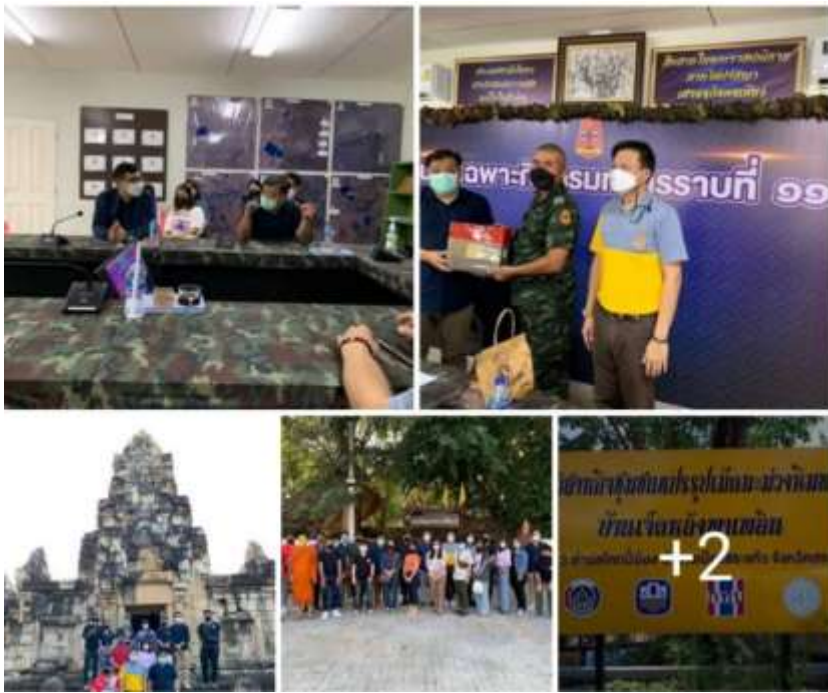
ภาพที่ ๑๒ กิจกรรมเสริมหลักสูตร: การลงพื้นที่ฝึกประสบการณ์เก็บข้อมูลวิจัยของนิสิตหลักสูตร รม. (ยุทธศาสตร์และความมั่นคง) ณ หน่วยเฉพาะกิจ กรมทหารราบที่ ๑๑๑ อำเภอตาพระยา และวิสาหกิจชุมชนบ้านเจ็ดหลัง จังหวัดสระแก้ว ระหว่างวันที่ ๒๙- ๓๐ มกราคม พ.ศ. ๒๕๖๕