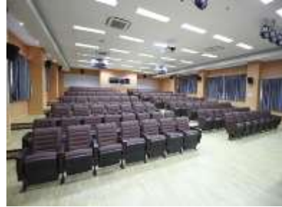
คณะ มีห้องปฏิบัติการ คอมพิวเตอร์ อยู่ ที่อาคารคณะ

รัฐศาสตร์และนิติศาสตร์ 1 (POLLAW-1) ชั้น 3 จำนวน 2 ห้อง มีความจุห้องละ ๕๐ ที่นั่ง มีคอมพิวเตอร์แบบ all in one ที่ทันสมัย ติดตั้งเครื่องปรับอากาศ เครื่องฉาย LCD และเครื่องขยายเสียง และอินเตอร์เน็ตความเร็วสูง เพื่อรองรับการจัดการเรียนการสอนในรายวิชาเทคโนโลยีสำหรับ| นักบริหาร การจัดการกิจกรรมอบรมโปรแกรมคอมพิวเตอร์ให้กับนิสิตชั้นปีที่ ๔ ก่อนสำเร็จการศึกษา นอกจากนี้ ห้องปฏิบัติการคอมพิวเตอร์ทั้ง ๒ ห้อง ยังเปิดให้บริการสำหรับนิสิตภายในคณะที่ต้องการใช้เครื่องคอมพิวเตอร์ในการค้นคว้าหาข้อมูลเพิ่มเติมจากการเรียนการสอน การใช้เครื่องคอมพิวเตอร์ทำรายงาน และทำวิจัย ในช่วงเวลาที่ไม่ได้ใช้ในการเรียนการสอน ซึ่งนิสิตสามารถแจ้งเจ้าหน้าที่ผู้ดูแลได้ที่ห้องเทคโนโลยีสารสนเทศ (IT) ชั้น ๒