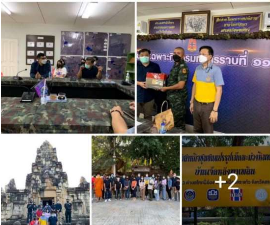
ภาพที่ ๗ การลงพื้นที่ฝึกประสบการณ์เก็บข้อมูลวิจัยของนิสิตหลักสูตร รม. (ยุทธศาสตร์และความมั่นคง) ณ หน่วยเฉพาะกิจ กรมทหารราบที่ ๑๑๑ อำเภอตาพระยา และวิสาหกิจชุมชนบ้านเจ็ดหลัง จังหวัดสระแก้ว ระหว่างวันที่ ๒๙- ๓๐ มกราคม พ.ศ. ๒๕๖๕

๒.๓.๓ The teaching and learning activities are shown to involve active learning by the students.