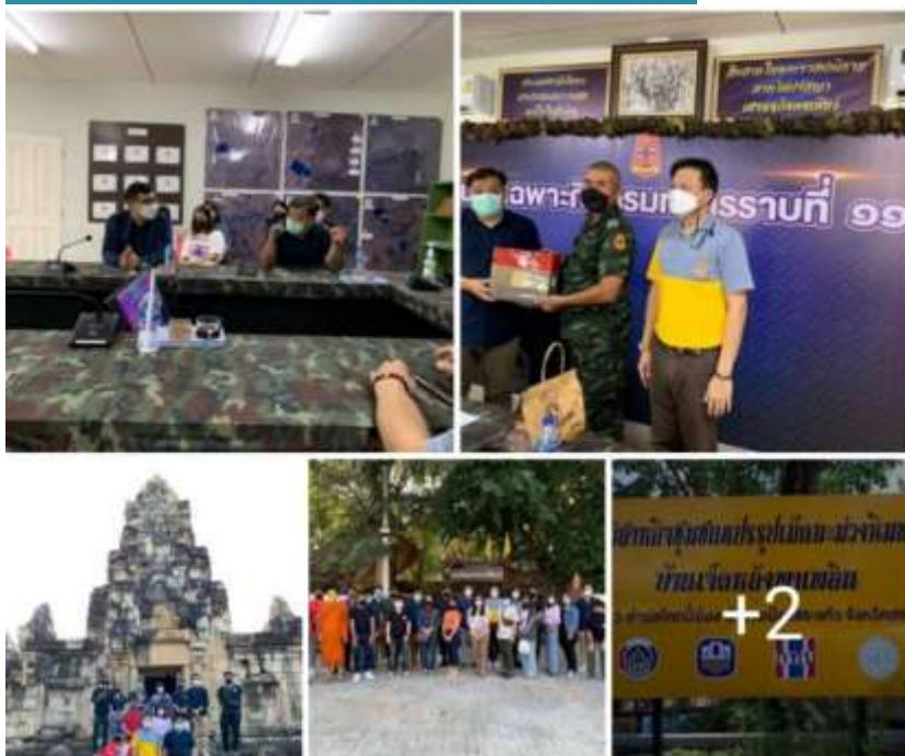
ภาพที่ ๑๖ กิจกรรมเสริมหลักสูตร: การลงพื้นที่ฝึกประสบการณ์เก็บข้อมูลวิจัยของนิสิตหลักสูตร รม. (ยุทธศาสตร์และความมั่นคง) ณ หน่วยเฉพาะกิจ กรมทหารราบที่ ๑๑๑ อำเภอตาพระยา และวิสาหกิจชุมชนบ้านเจ็ดหลัง จังหวัดสระแก้ว ระหว่างวันที่ ๒๙- ๓๐ มกราคม พ.ศ. ๒๕๖๕