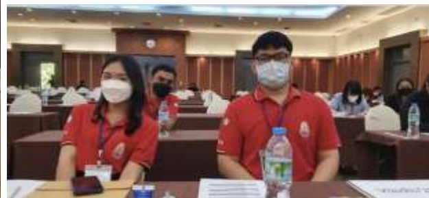
ภาพที่ 13 กิจกรรมเสริมหลักสูตร: นิสิตหลักสูตร รม. (ยุทธศาสตร์และความมั่นคง) ฝึกประสบการณ์เป็นผู้ช่วยจัดสัมมนาวิชาการระดับชาติ PSPARN 2022 ณ โรงแรมเทา-ทอง มหาวิทยาลัยบูรพา ระหว่างวันที่ 22-24 เมษายน 2565